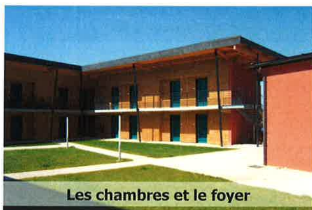
Les chambres et le foyer

Le CFPPA dispose de 38 chambres individuelles meublées avec coin toilette comportant douche, lavabo et WC. Le foyer comprend un coin cuisine et restauration et un espace détente avec télévision.